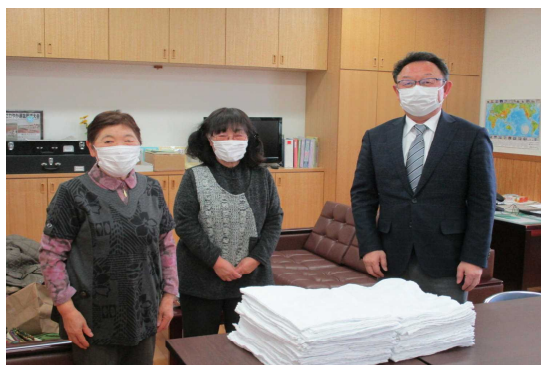
大沢老人クラブの 婦人部のお二人

今年度も、大沢老人クラブの皆さんからぞうきんを70枚いただきました。大きさも厚さもちょうどよく、使いやすいようなぞうきんです。ありがたく使わせていただきます。毎年、ありがとうございます。