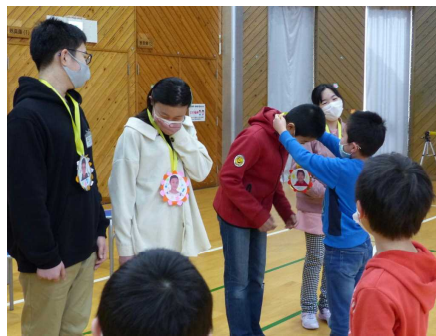
1年生からのプレゼント