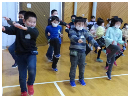
3年生も一緒にノリノリ!