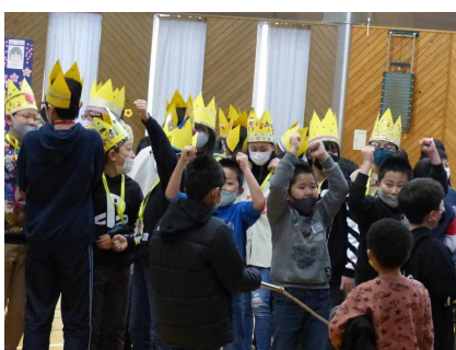
〇×クイズで大盛り上がり