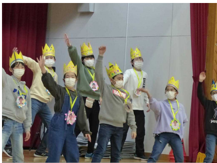
6年生の元気なダンス発表