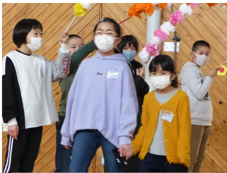
花のアーチから入場です

企画・進行は、次のリーダーを務める5年生が頑張り、4年生は6年生のそっくりな似顔絵、3年生はきれいな王冠、1・2年生はかわいいプレゼントを用意して贈りました。6年生からのお返しの歌やダンスでは、全校で盛り上がっていました。やさしく仲良しで元気な峰っ子らしい、心温まる会になりました。