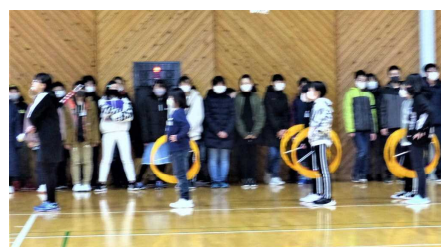
6年生が練習を見守ります