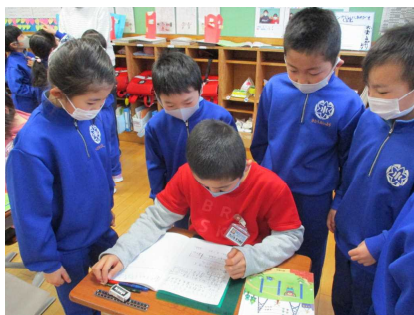
2年生も緊張して頑張ります

3学期は、子ども達が1つ上の学年の授業を参観する機会をつくっています。1年生は2年生の授業、2年生は3年生の授業、といった具合です。