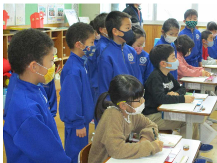
1年生が2年生の授業参観