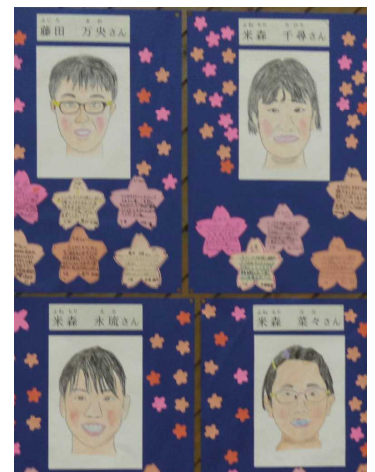
本人にそっくりでした