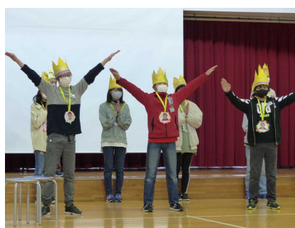
6年生からの「エール!」