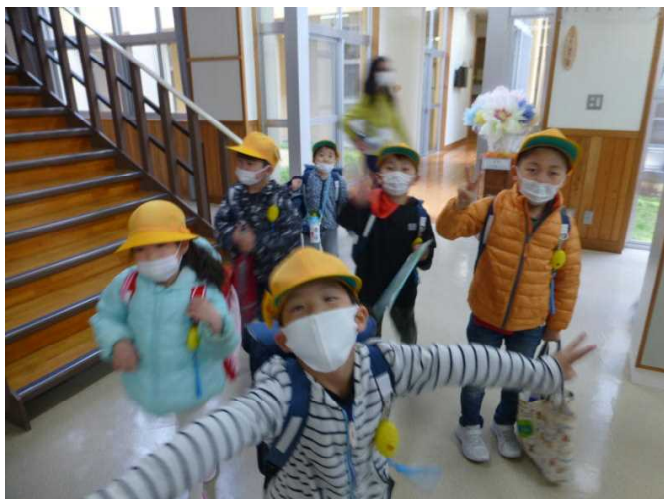
1年生 4月20日、明日から臨時休校の帰り