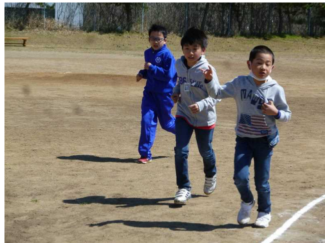
走ろうタイム、なかなかいい走りの男の子たち