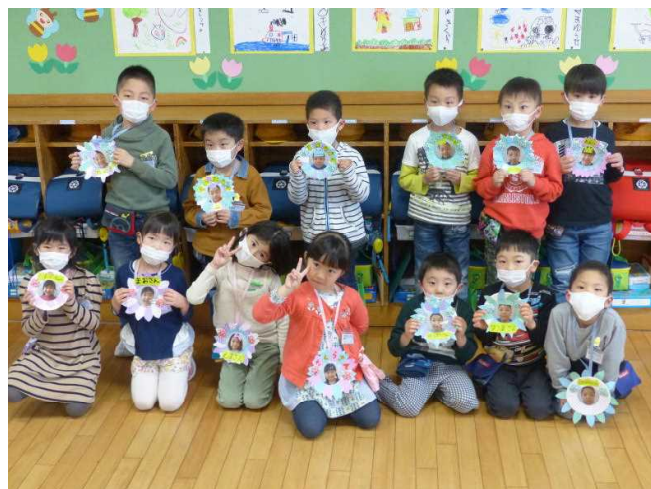
メダルをかけて大喜びの1年生、ピース！