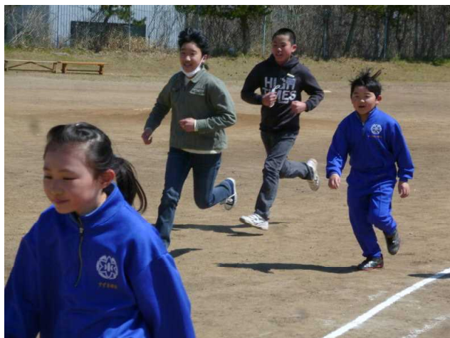
みんなで走ると、元気がぐっとアップ！