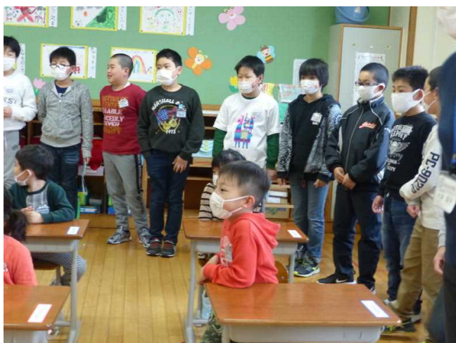
6年生が、1年生に歓迎のメダルをプレゼント