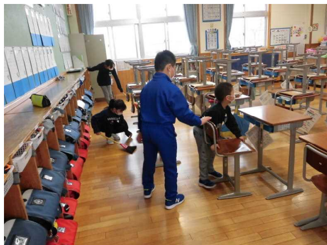
縦割り班掃除で、1年生に教えてあげます