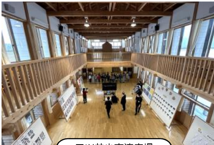
二ツ井小交流広場

そして、今回で6年生運営委員会の司会は最後となります。3月の全校集会は、5年生の運営委員が、委員会のバトンを引き継ぎ運営します。