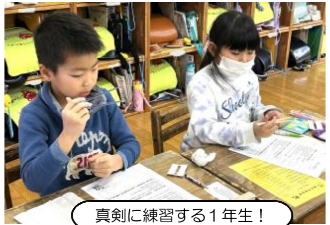
真剣に練習する1年生！