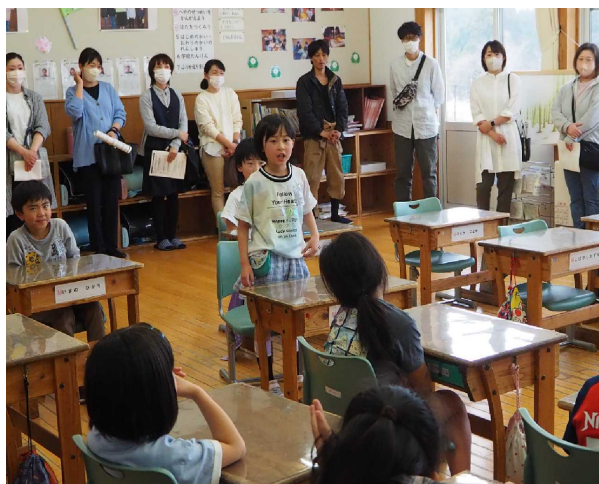
2年松・桜組の授業