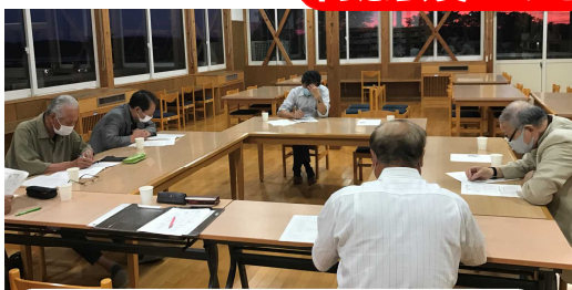
9/10(金)R3同窓会総会にて

今年度も各地区の常任委員様にご難儀をおかけし、浅内小同窓会の皆様625戸より会費をいただきました。本来であれば懇親会において感謝申し上げるべきところですが、感染症対策のためR2・3年度は懇親会無しの総会を行っております。R2年度は、教育振興助成としていただいている10万円をチューリップ球根・花壇用ホース・プール用テント・一輪車等に活用させていただきました。浅内小学校同窓会員の皆様、本当にありがとうございました。