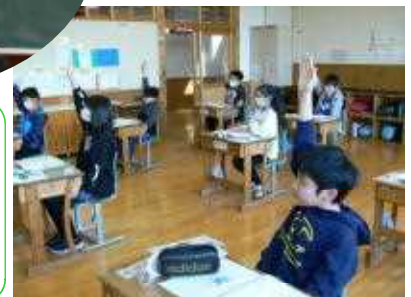
意欲満々で学ぶISさん (手前)

左は、初めての外国語活動に挑む3年生の様子。大きな声で発話を楽しんでいます。右は、真剣に学び合う5年生：算数の時間の様子です。専門分野で活躍する先生と担任の先生とが共にアイデアを出し合いながら、子どもたちのために魅力ある授業を展開しています。