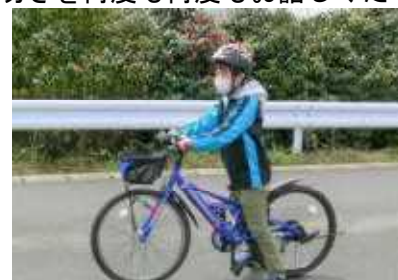
乗る前に安全確認するHDさん(5年)