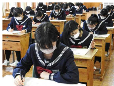
テストに真剣に臨む(2年生)

25日、第3回全校テストがありました。各学年とも真剣に問題に向き合っていました。