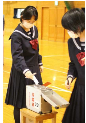
昨年度の投票の様子

次期生徒会を担う大事な会長選挙は、各立候補者のポスター及び公約が正面玄関前に公示され、明日1日より朝の選挙運動が始まります。期間中は、各立候補者による公約説明会や学級討議を経て8日の立会演説会・投票、