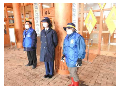
朝の温かいあいさつ(26日)

第4金曜日の朝に行い、今月で第5回を数えました。生徒を温かいあいさつで迎えてくれた皆様へ感謝いたします。