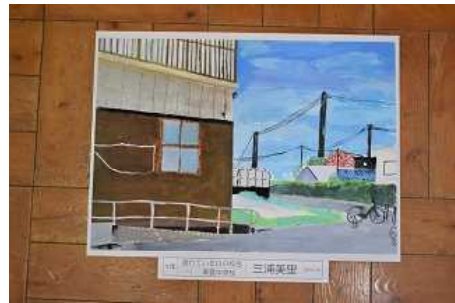
1年 三浦 美里