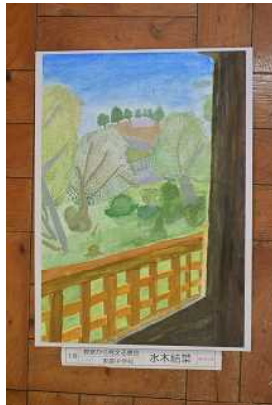
1年 水木 結菜