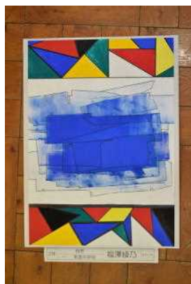
2年 福澤 綾乃