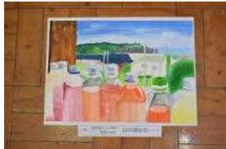
1年 田中 愛結海