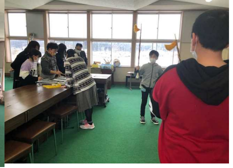
先輩から後輩へ技術を伝授