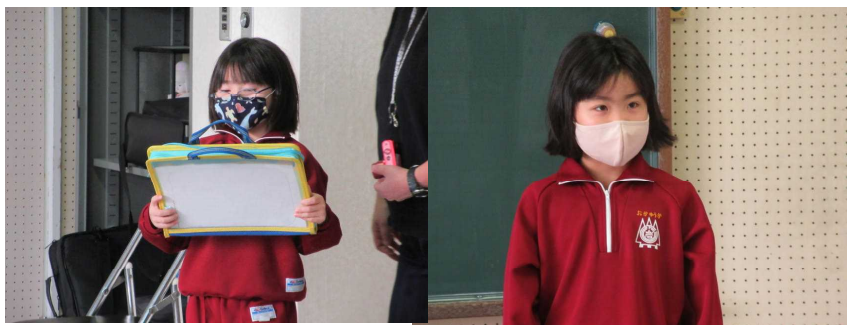
堂々とした司会ぶり

司会の1年生も大活躍でした。全員に活躍の場がたくさんあることは、小規模校のよさだと感じています。今後も一人一人の話す力を鍛えていきたいと思っています。