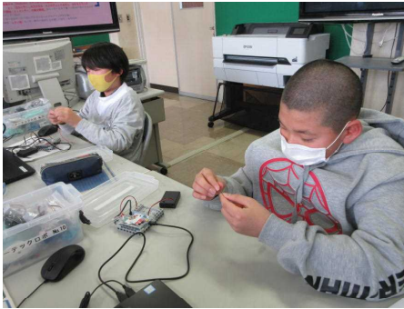
まずは、道具を作ろう