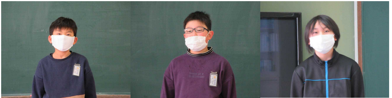
今年目標を力強く発表