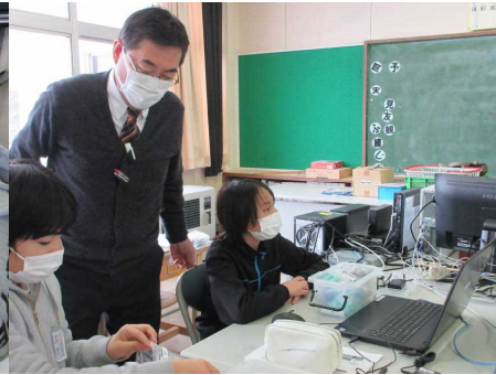
道具を作ったら命令を入れよう