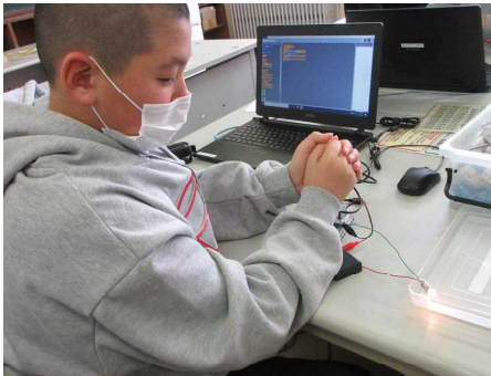
大成功！明かりが点いた