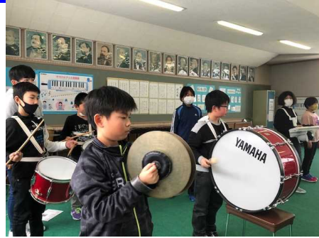
新鼓笛隊の練習がスタート！

現在、鼓笛隊の引継ぎが行われています。6年生を送る会で披露しますので、お楽しみにしてください。下の写真は、6年生のプログラミング学習の様子です。コンピュータに命令を打ち込んで、いろいろな物を動かしました。全員大成功でした！