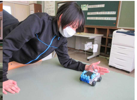
止める命令が働いたよ！