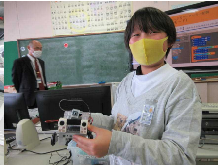
これが完成したモーターカー