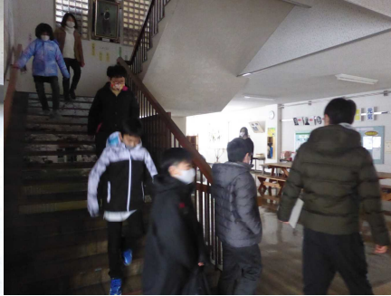
防寒着を着て静かに避難