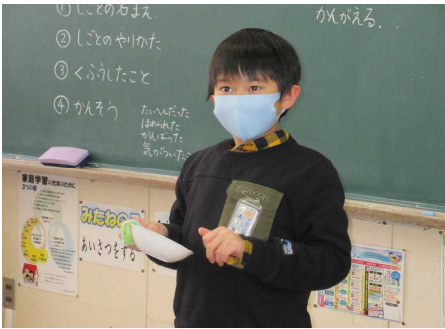
食器洗いをしたよ