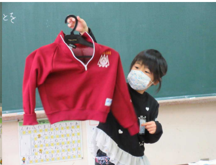
ハンガーを下から入れて干すよ