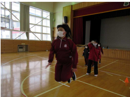
タイミングよくピョーン！