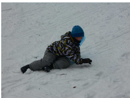
転ぶのもまた楽しい～