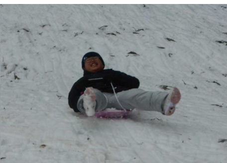
絶叫が聞こえてきそう