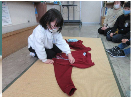
マジックのような畳み方！