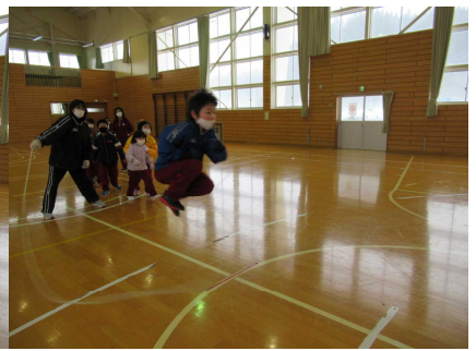
ピョピョピョーン！