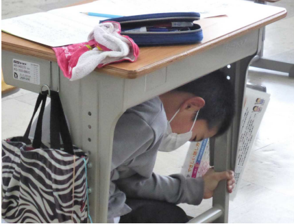
体を低く、頭を守り、動かない

今年度3回目の避難訓練を行いました。地震が発生し、防寒着を着て避難する途中に余震が起こるといった想定です。子どもたちは、しっかり放送を聞き、落ち着いて避難することができました。東日本大震災からまもなく10年、ご家庭でも、家族の安全の確認方法や避難場所などについて、話題にしていれば幸いです。