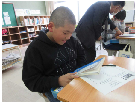
教科書も税金で作られているよ

先日、6年生で、税理士さんを講師に租税教室が行われました。税金は消防署や公園、道路や橋、病院などに使われていること、約50種類もあることなどを知ることができました。人々が安心して生活するためには税金が必要であり、国民には納税義務があることなど、社会科で学習したことを確認することができました。