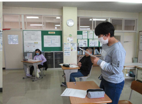
今日の学習をまとめよう