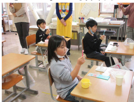
歯ブラシを点検してみよう

3・4年生では、歯みがきの仕方の他に、むし歯の原因についても学習しました。ジュースやアイスクリーム、お菓子などに含まれている砂糖の量や、おやつを取り方も学ぶことができました。一生使う歯なので、大事にしていきたいものですね。