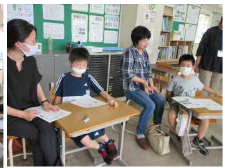
3・4年生はみんなで考える道德