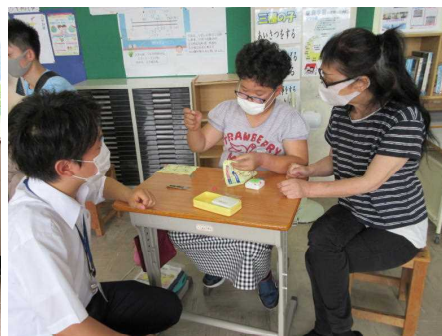
5年生はボタン付けにチャレンジ