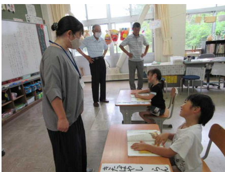
複式にすっかり慣れた1年生

1学期の登校日は、残すところ6日となりました。首都圏での新型コロナ感染者の増加が気になるところですが、これまで通りの感染症対策をしながら安全に過ごせるようにしたいと思います。ご協力をよろしくお願いいたします。