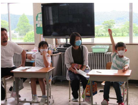
道德ではいろいろな意見が出ました