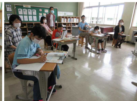
資料を読んで考える6年生