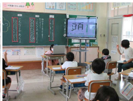
自分たちで学習を進める2年生