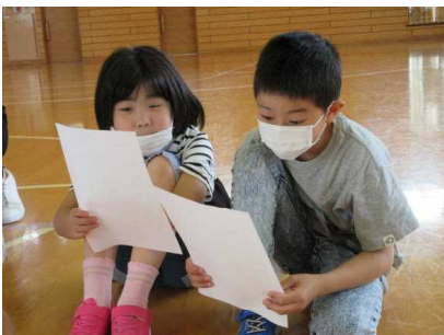
ペアで実際に会話をしてみよう