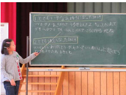
事前のアンケートから

その後、ペアで3つの話し方で会話をし、これまでの自分の話し方を振り返ったり、気持ちのよい話し方について考えたりすることができました。自分の話し方を変えるのは難しいことですが、自分も相手も大切にしたい話し方を目指していきたいと思います。