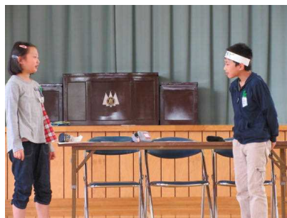
迫真の演技に全校が釘付け！