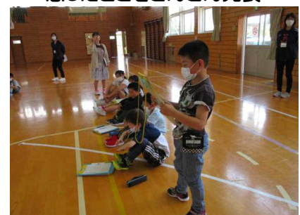
これからこんな話し方をしたい