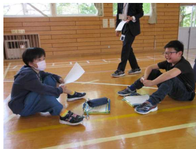
どんなふうに話したらよいのかな