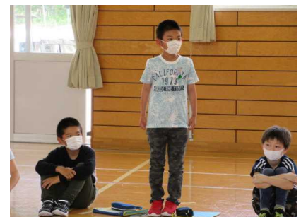
感じたことをどんどん発表