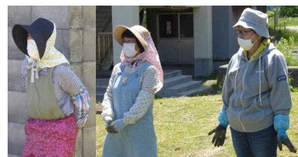
お助け隊の皆様 いつもありがとうございます