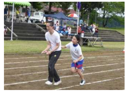
親子で楽しんだPTA種目