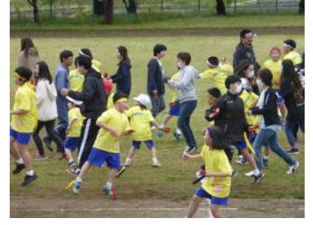
今年も親子で「どっこいしょ」