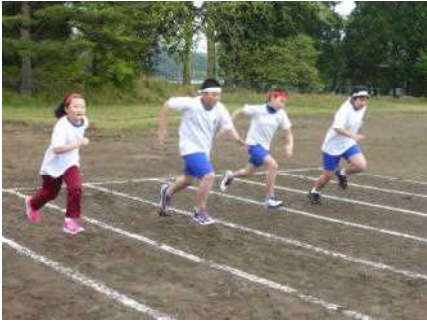
力強い6年生の走り