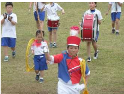
息がぴったりな鼓笛演奏