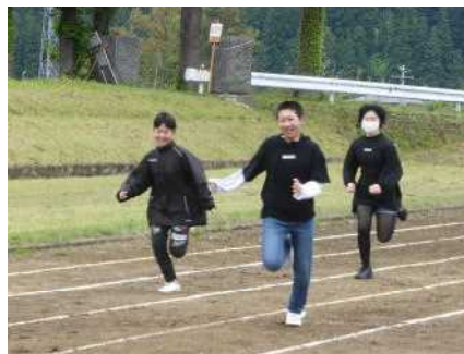
先輩の中学生も飛び入り参加