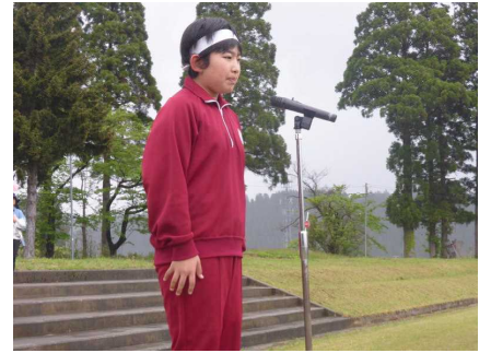
児童会運営委員のお話