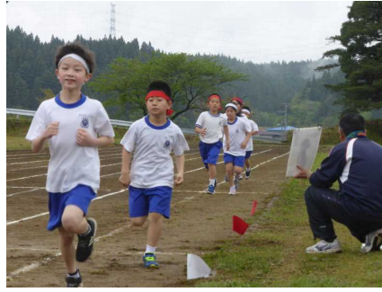
3・4年生 700M持久走を完走