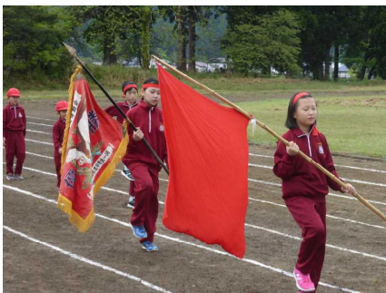
今年も優勝するぞ！

PTA役員の皆様には、早朝から会場準備にご協力をいただき、ありがとうございました。また、ご家族の皆様、地域の皆様には、子どもたちへの温かいご声援やたくさんの拍手、そして種目へのご参加をいただき、心から感謝申し上げます。これからも、保護者や地域の皆様に元気や笑顔をお届けできるように、行事等に取り組んでまいります。今後ともご協力をよろしくお願いいたします。