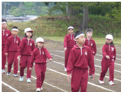
今年こそ優勝旗を白組へ！