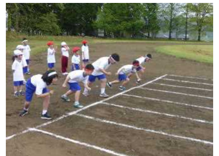
5年生の100M走からスタート