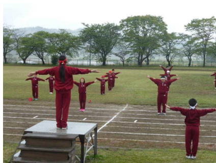
準備運動は健康委員が示範