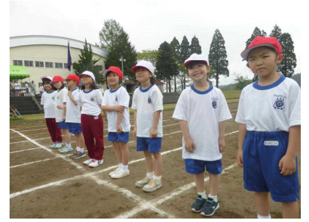
1・2年生 持久走前の余裕の笑顔