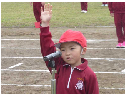
1年生 初めての宣誓 立派！