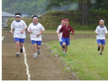
友達とともに全員完走!!