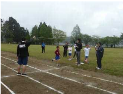
5・6年生 1000走を走り抜く!