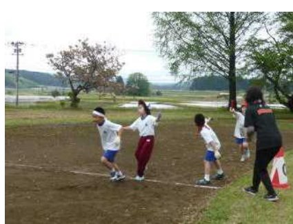
白熱した色別対抗全員リレー