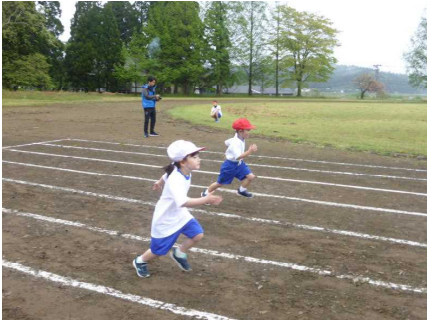
1年生は2人で80Mを力走