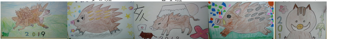
2 6 班