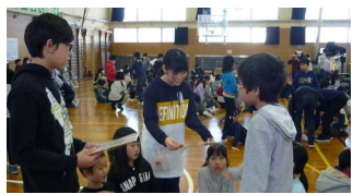
色紙のプレゼント