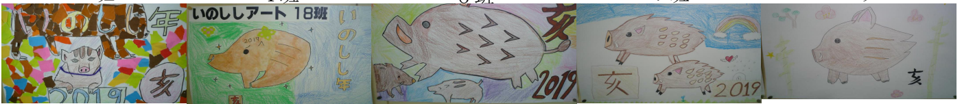
1 5 班