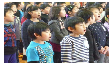
全校合唱「翼をください」