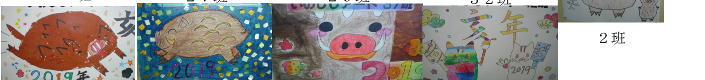
3 4 班