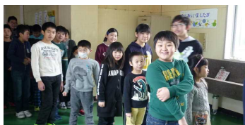
1年生と整列し入場待ち