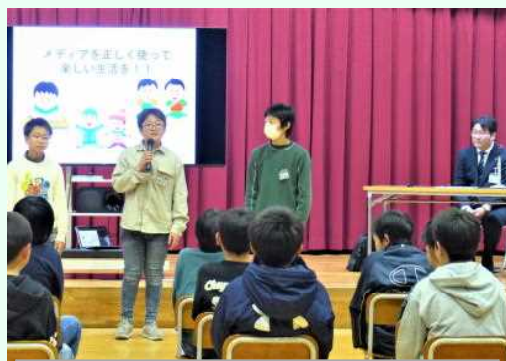
メディア教室で保護者とともに ネットやゲームとの付き合い方を 学ぶ峰っ子。冬休みも約束を守ろうね!

終業式では、3人の代表児童が、「2学期の思い出と冬休み中にがんばりたいこと」を発表しました。どうかご家庭でも、お子様の成長について声を掛け、思い出を話題にして、前向きな気持ちで新しい年をお迎えくださればと思います。皆様、どうぞよいお年を。