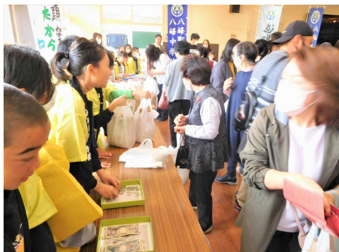
田植えから愛情をもって育てた峰っ子米。お客さんとのやりとりも絶妙で見事完売！