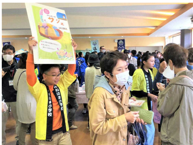
ラベンダーの香り袋（サシェ）をPRする4年生。お客さんの人気も上々です！