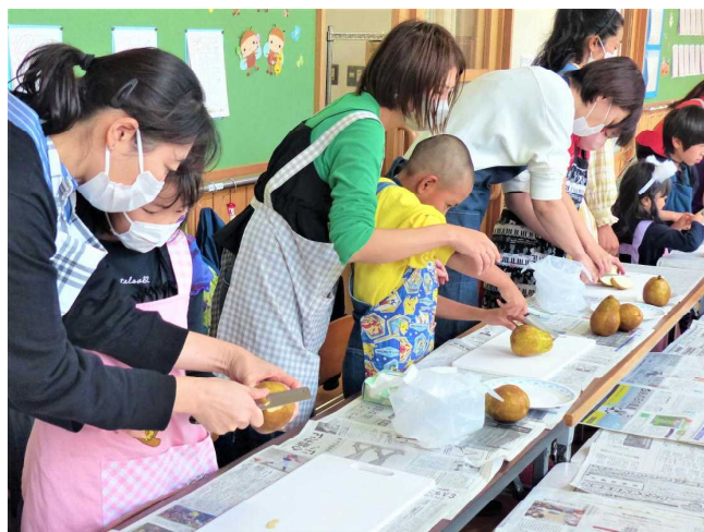
3年生は梨博士。でも皮むきは苦手？試食の後にはハロウィンパーティだ！