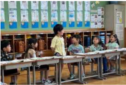
1年：道徳「みらいが かいた え」

6月は全職員が一丸となって学力向上に励んでいます。6月18日には、県教育委員会や町教育委員会の授業参観があり、児童の成長ぶりをたくさん評価していただきました。これからも、本校教育活動へのご理解ご協力をよろしくお願いします。