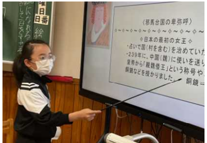
6年：社会「縄文のむらから古墳のくにへ」