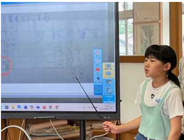
4年：算数「小数のしくみを調べよう」