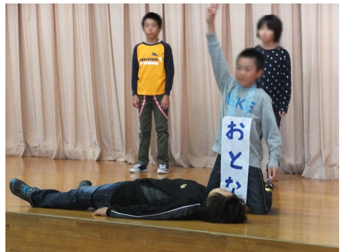
10/15 健康集会（AEDの使い方、救急車の呼び方などを学びました。）