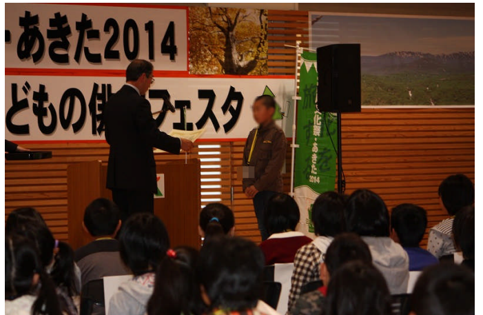
10/12 国民文化祭 八峰町 子どもの俳句フェスタ 表彰式