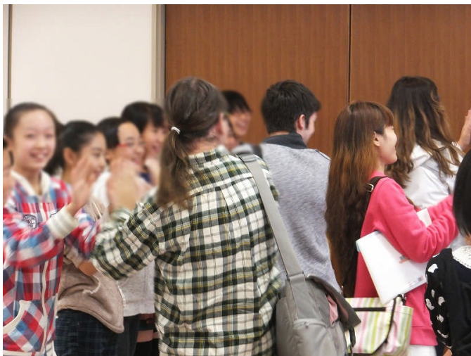
留学生の皆さんとお別れ