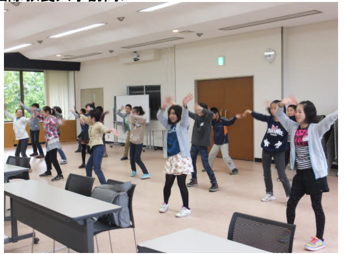
お礼のダンス《インベーダ・インベーダ》