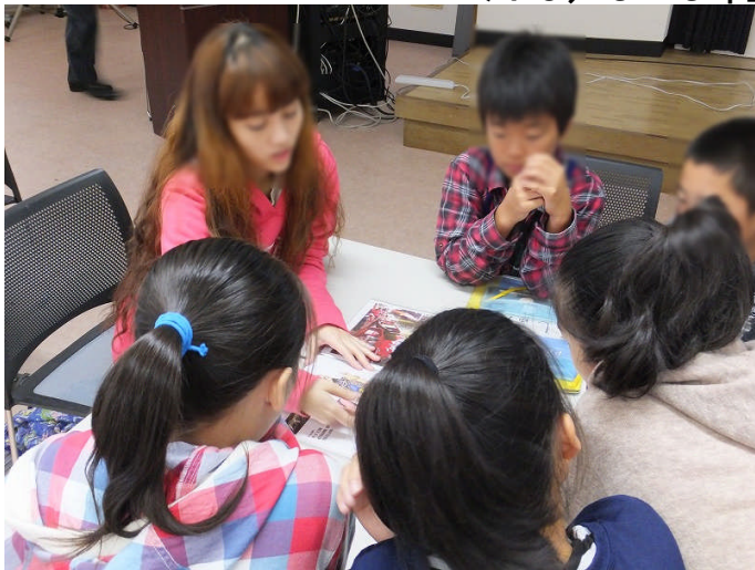
グループで留学生との交流