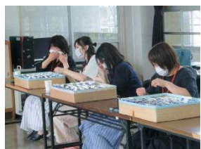
種類によって分別