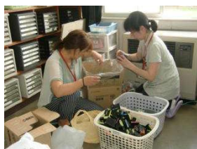
インクカートリッジも対象