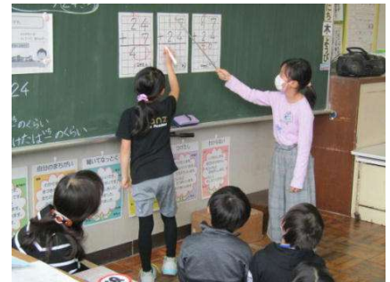
5月 授業が軌道に乗りました