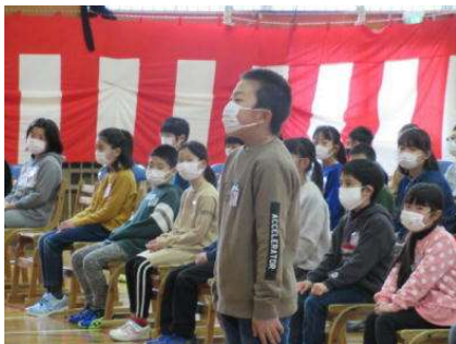
4月 新任式 児童の歓迎の言葉