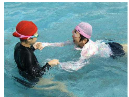
7月 プール授業スタート

学校HPの「南っ子Topics」にも4～7月の様子をアップしておりますので、ご覧ください。