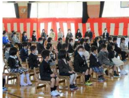
4月 入学式 1年生がんばりました