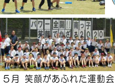
5月 笑顔があふれた運動会