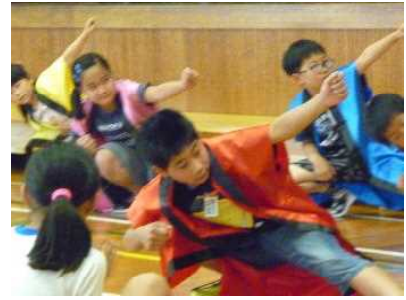
【全校児童22名 一丸となって披露したニューソーラン節】

迫力のある発表で、他の学校の友達から大きな拍手をもらいました。全校一丸となって取り組む朴瀬小学校のよさが発揮された発表だったと思います。