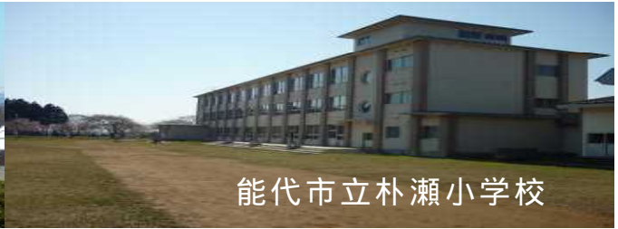
能代市立朴瀬小学校