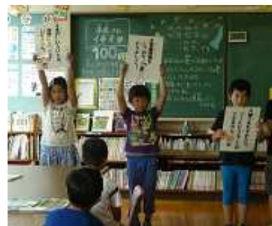
【元気保健委員会の発表】