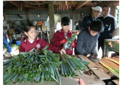
【10月13日ネギの製品化】