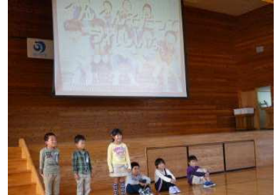
【10月5日ミニ種苗交換会】