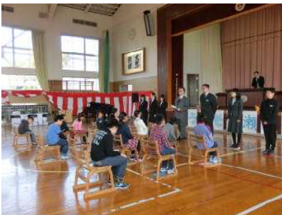
【4月6日 始業式 担任発表】

いかがでしたでしょうか。最終号にあたり、写真で今年1年間を振り返りたいと思います。