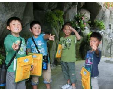
【9月12日1・2年校外学習】