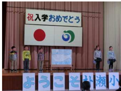
【4月7日 入学式 歓迎発表】