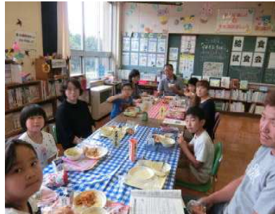
【7月5日 給食試食会・バブルサッカー】