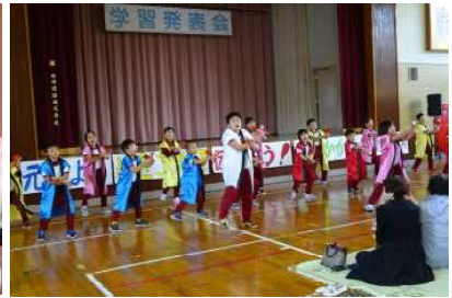
【10月15日 学習発表会 練習の成果を生かし堂々の発表】