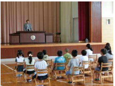
【8月25日二学期始業式】