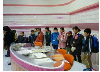
【11月20日 全校校外学習（秋田市へ）】