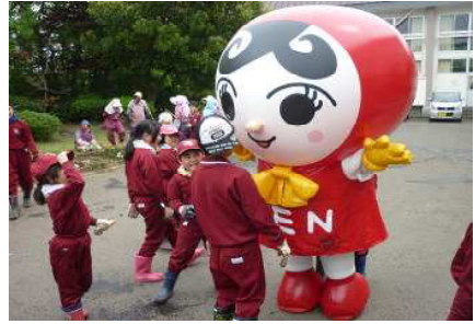
【5月25日 農園・花壇作業 (人権の花)】