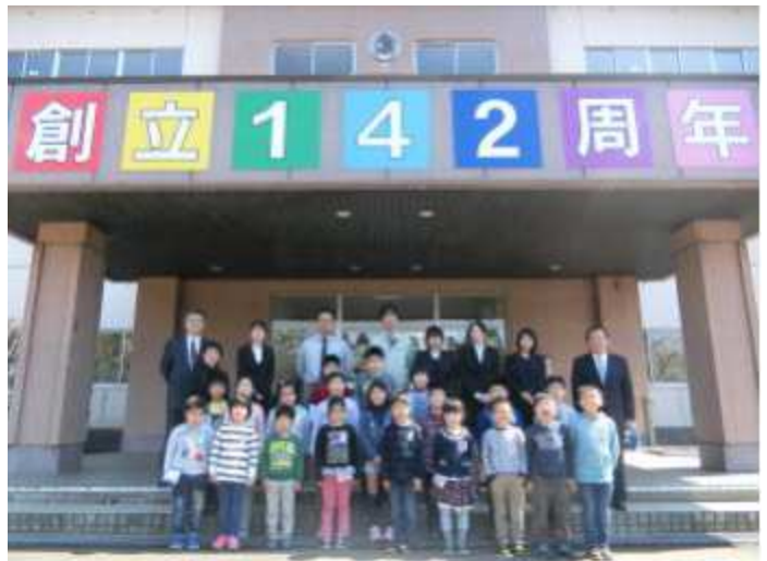
【4月27日撮影 全校写真】

平成30年度も、子どもたちの輝く姿で満ちた朴瀬小学校でありますように、職員一同頑張っていく所存であります。平成30年度もどうぞよろしくお願いいたします。