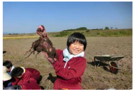
【9月26日サツマイモ収穫】