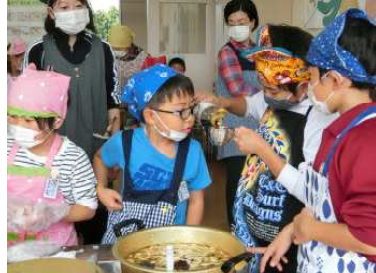
【9月29日だまこなべ交流会】