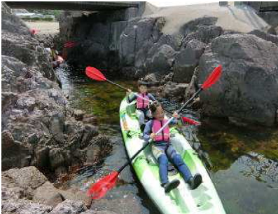
【6月28・29日宿泊体験学習】