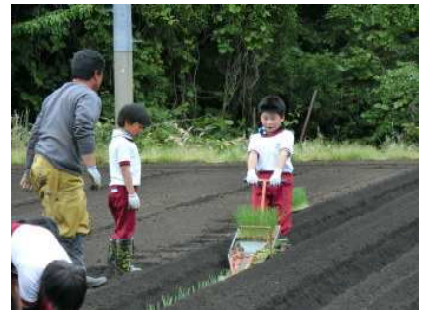
【6月7日 ネギの植え付け】