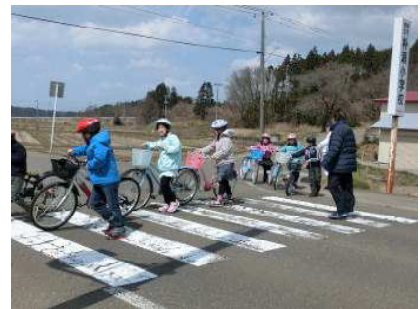
【4月12日 交通安全教室】