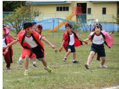
【5月14日 大運動会 (とても盛り上がりました)】