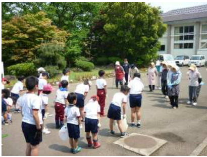
【5月31日 クリーンアップ作業】