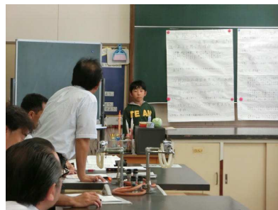
【堂々と発表を頑張る子どもたち】