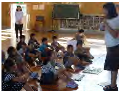
【お話をしっかり聞く 子どもたち】