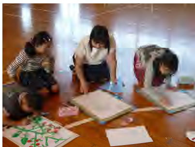
【一人一人の作品にアドバイスしてくださいました】