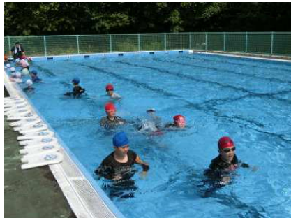
【プールの中を歩いてみます】