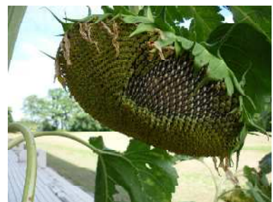
【種をつけたヒマワリ】

1日1日の変化は目に見えないけれど、こんなに大きく成長したんですね。夏休みの34日間で、みなさん一人一人もきっと大きな成長があると思います。今日は、先生と友達とで夏休みについて振り返りながら、このことも話してみてください。