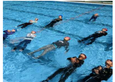
【浮いて待つことができました！】