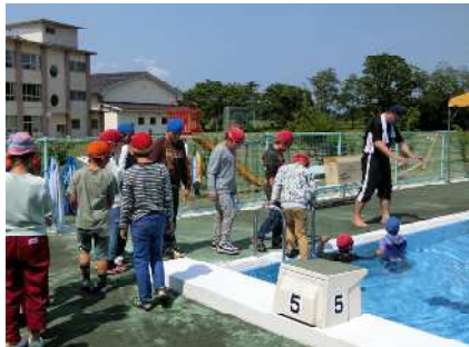
【衣服を着てプールへ】