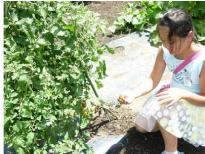
【ミニトマトを収穫】