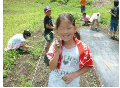
【ニンジンを見つけました】

夏休み中もさらに生長し、たくさんの収穫があると思います。学校では日直の先生がお世話をし、プール開放で来た子どもたちと共に観察したり、収穫したりしながら、学習が継続するようにいたします。子どもたちの「生きてはたらく力」となる学習です。