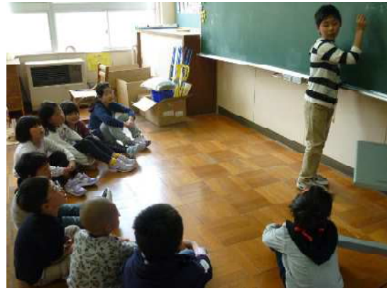
【赤組・・・5年生を中心にミーティング】