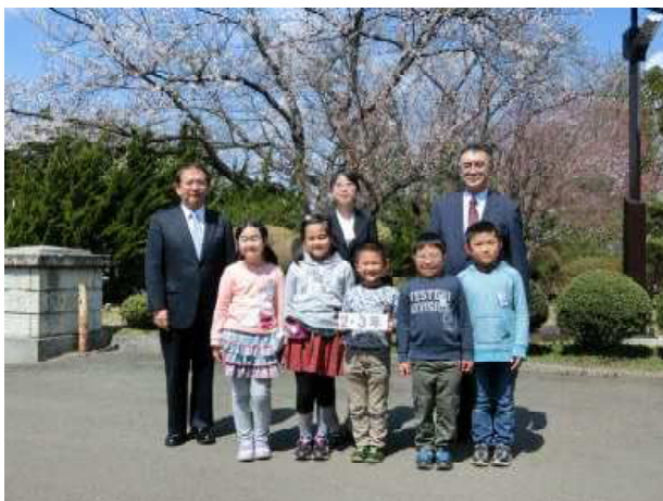
【2・3年生・・・明るく楽しげです】