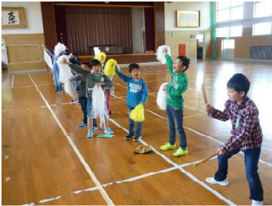
【白組・・・応援の仕方を確認】