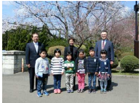
【1年生・・・姿勢が立派です】