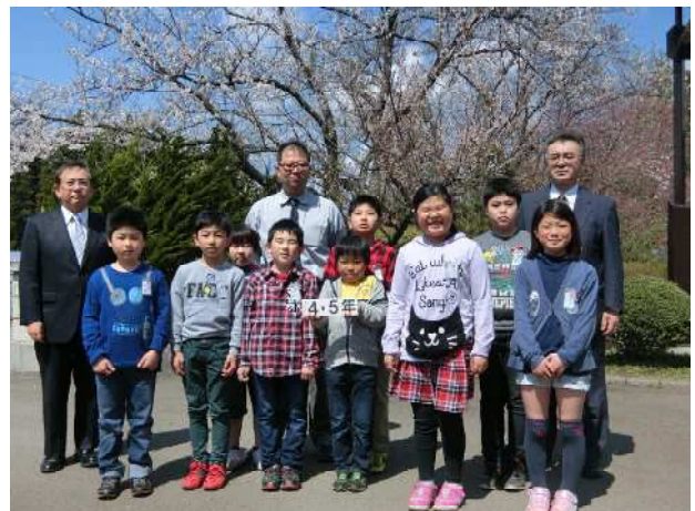
【4・5年生・・・上学年の貫禄です】