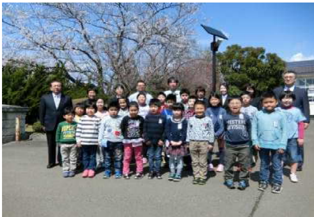
【全校の児童・職員で】

さて、学校内では昨年度の掲示物を平成29年度バージョンにするように少しずつですが取り組んでおります。その一つとして、4月28日の昼休みの時間に学級写真、全校写真を撮影いたしました。桜満開となったこの日、桜を背景の全校写真・学級写真と、校舎を背景にした全校写真を撮影しました。校内、職員室前に掲示しておりますので、学校にお越しの際にご覧ください。