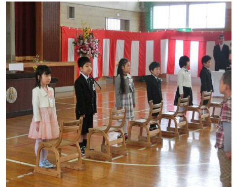
【立派な姿勢の新1年生】