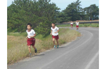
㊵ 羽州街道マラソン大会