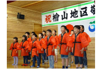
㊟ 檜山地区敬老会参加