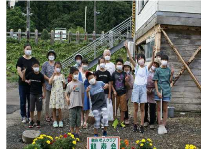
老人クラブの方と鶴形駅清掃

今日から、前期後半が始まりました。新型コロナウイルス感染症が拡大している中での学校再開となります。学校では換気に十分配慮しながら教育活動を進めて参りますので、各家庭においても感染拡大防止に引き続きご協力をよろしくお願いいたします。もし感染が疑われる場合は、裏面に示した検査・受診の流れに沿って、対応をお願いします。