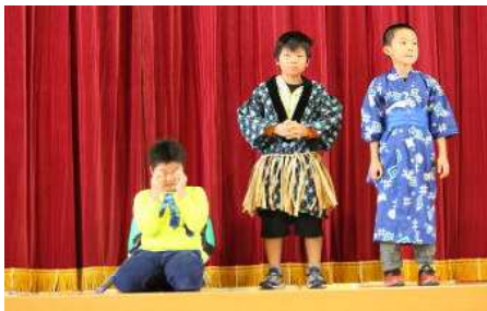
3年「英語うらしま太郎」