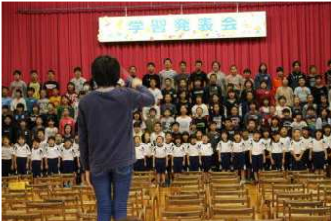
「歌声日本一の全校合唱」

保護者のみなさまも、近所の方々をお誘い合わせの上、お越しくださいますようお願いいたします。