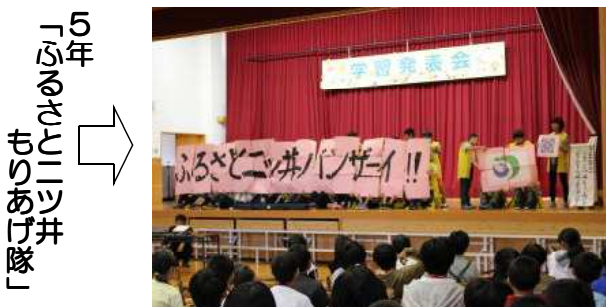
5年 「ふるさとニツ井 もりあげ隊」