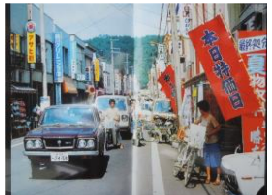
* にぎわっていた頃の駅前通りの写真