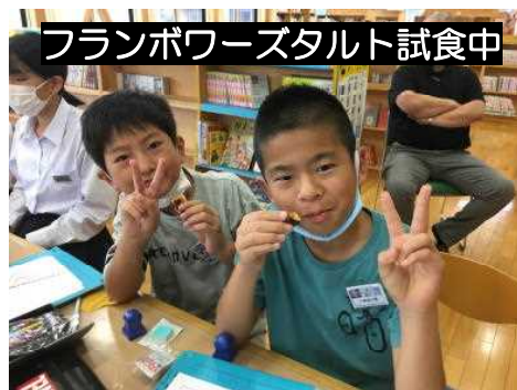
フランボワースタルト試食中

多くの方々に来場していただけるような楽しいイベントを計画中です。どうぞご期待ください。