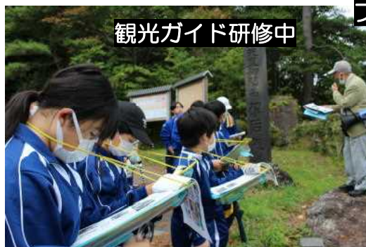
観光ガイド研修中