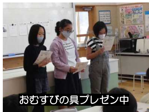
おむすびの具プレゼン中