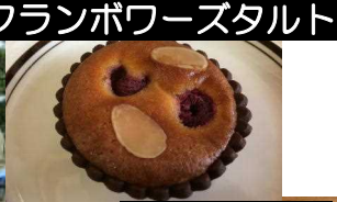
フランボワースタルト