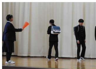
執行部による寸劇

9日(木)には新入生歓迎会が行われ、生徒会執行部が学校生活の1日を寸劇で楽しく紹介しました。また、部活動紹介では各部が趣向を凝らして1年生にアピールし、最後に応援団からのエールが送られました。