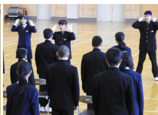
応援団からのエール