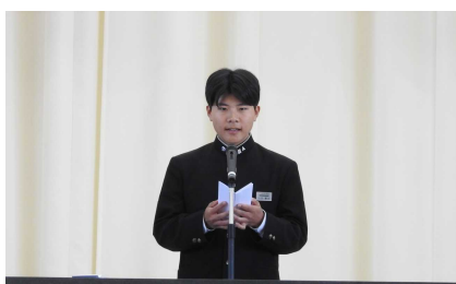
生徒会長が「全校生徒とともに二中を盛り上げ、感動を分かち合ひましょう」と歓迎の言葉を述べました。