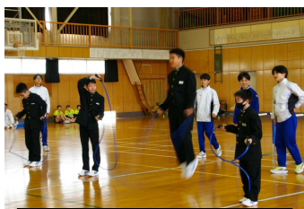
陸上部の練習を1年生も体験