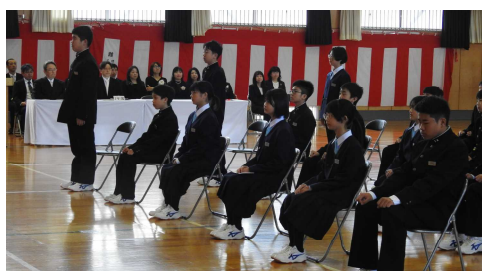
担任の先生から名前を呼ばれ元気に返事をして起立した新入生22名。話を聞く態度も大変立派でした。

本校職員一同、保護者や地域の皆様のご支援・ご協力を得ながら、校訓、学校教育目標の具現化に向けて、様々な活動に取り組み、子どもたちが将来たくましく生き抜く力を身に付けることができるよう精一杯がんばります。よろしくお願いいたします。