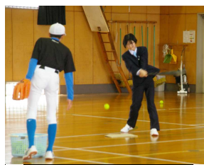
野球部の練習も体験