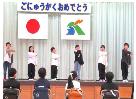
式が始まる前から気合ぼっちり！元気いっぱいの1年生ですよ。