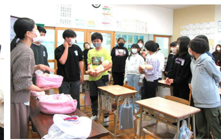
6年生 命の授業、みんな真剣 赤ちゃんの重さは命の重さ