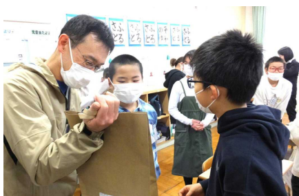
5年生 社会科の輸出入 高学年らしく堂々と発表