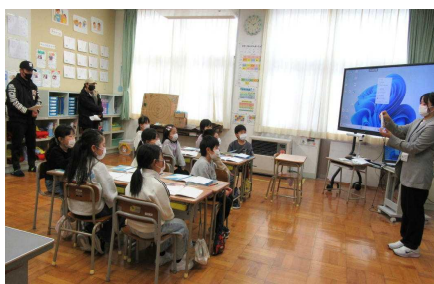
2年生 お家の方を前に 元気いっぱい発表