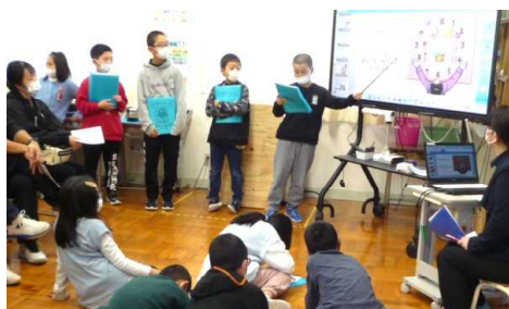
4年生 福祉についての学び、 体験して分かったことを発表