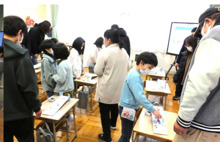
3年生 作った作品について 胸を張ってお家の方に紹介