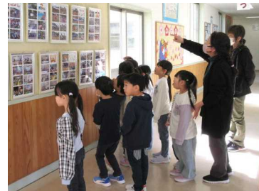
校内巡りをしました