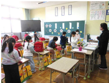
朝一番、提出物の確認です