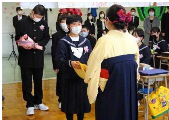
【学級で、「先生ありがとう」】