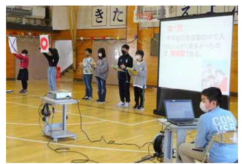
【6年生に関係のあるクイズ】

6年生はアーチをくぐって一人ずつ入場しました。台の上でポーズを決めてから、着席しました。始めに活動委員会と地区児童会の引き継ぎを行い、それから6年生へプレゼントを各学年ごとに届けました。心のこもったプレゼントに6年生も感激です。交流タイムはクイズで盛り上がり、最後に6年生がダンスを披露しました。キレッキレのダンスはさすが6年生。いつの間に練習していたのかな。全校のみんなで楽しい時間を過ごすことができました。