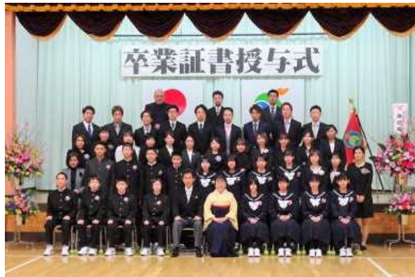
【卒業生と保護者の皆様】

卒業生が、八森小学校での思い出を胸に、中学校でもがんばろうと思えるような卒業式にできたと思います。