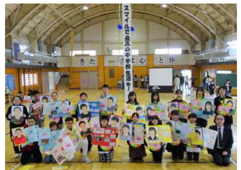
【1～5年生からのプレゼントを持って、ハイ！にっこり】

☆中学校で入りたい部活は、バスケット部が最も多く、次に多いのが野球部と吹奏楽部のようです。皆さん、がんばってください。