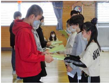
【5年生に引き継ぎます】

3月3日に、「6年生ありがとう集会」を行いました。 5年生を中心に在校生が企画し準備してきた集会です。各学年からのプレゼントもありました。