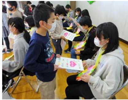
【3年生からお手紙のプレゼント】