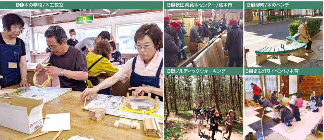
B1 木の学校/木工教室