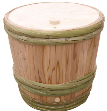
「木製の酒樽」 伝統の技術を、若い職人が引き継いでいます。

木都能代には“木材”を私たちの暮らしに活かす知恵と技術に優れたものづくりの会社が集まっています。先人から受け継いできた技と築かれた伝統に、新たな創意工夫を重ね、特長のある木材製品や技術は国内外へ提供されています。