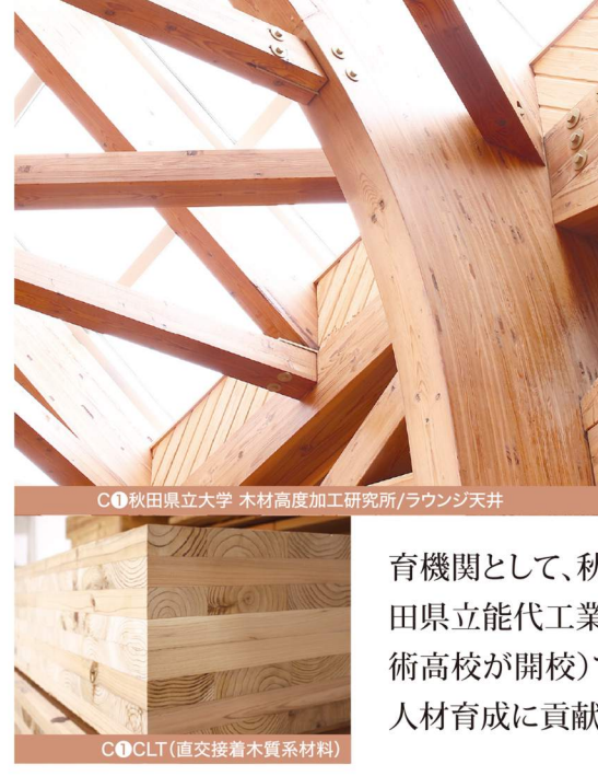
C1 秋田県立大学 木材高度加工研究所/ラウンジ天井