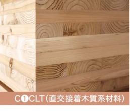
C1 CLT (直交接着木質系材料)