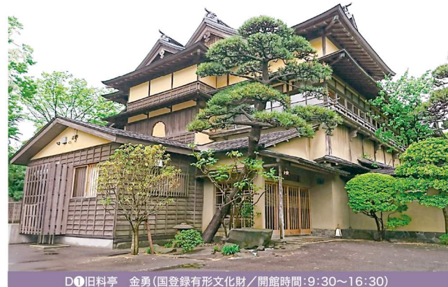
D1 旧料亭 金勇(国登録有形文化財/開館時間:9:30~16:30)