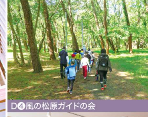
D4 風の松原ガイドの会