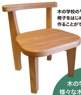
木の学校の「木工教室」では椅子をはじめ様々な作品を作ることができます。