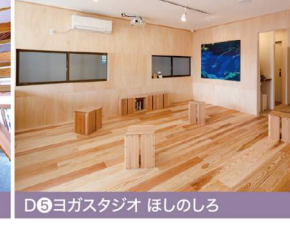
D5 ヨガスタジオ ほしのしる