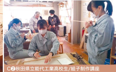
C2 秋田県立能代工業高校生/組子制作講座