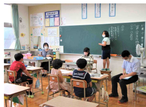
立石地区の話し合い

話し合いには各地区協力員の方々も参加し、いろいろとご助言いただきました。夏休みまであと1週間です。充実した夏休みになることを期待しています。