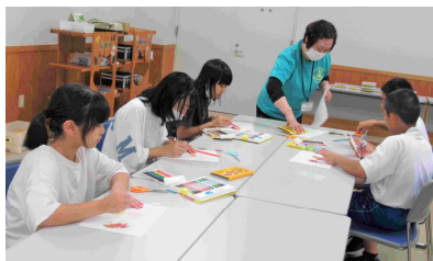
缶バッジ&しおり作り