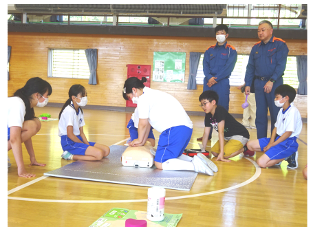
心肺蘇生トレーニングツール「あっぱくんライト」を活用して、胸骨圧迫(心臓マッサージ)の練習をしました。