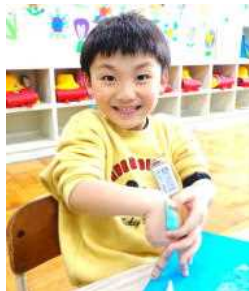
こびとをつくった碧生さん