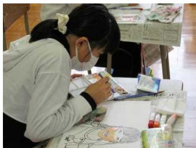
5年生とは思えない自画像のうまさにはびっくり!