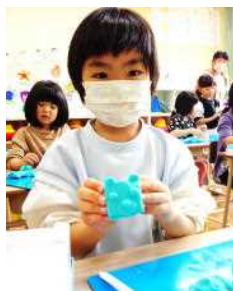
クマをつくった新菜さん